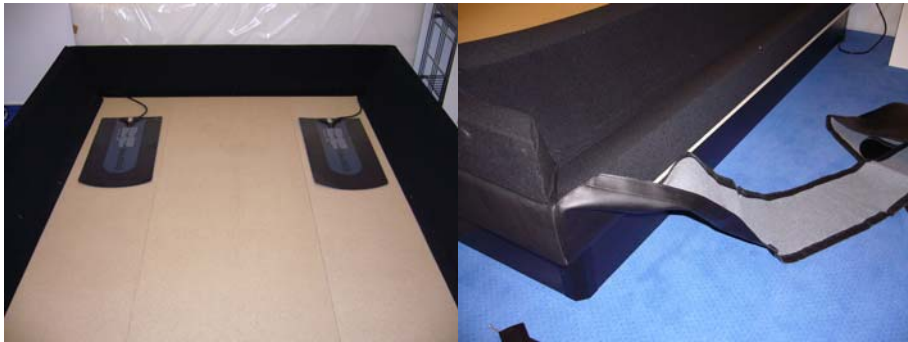
Læg varmelegeme(rne) på bundpladerne. Undgå samlingerne.