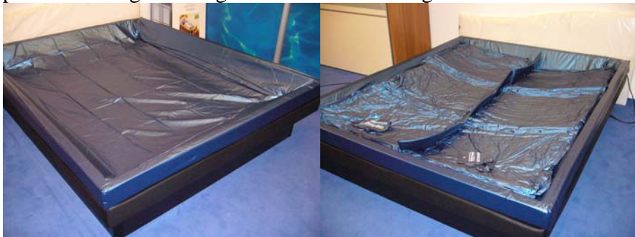
Læg sikkerhedsfolien i rammen, (over den øverste skum)